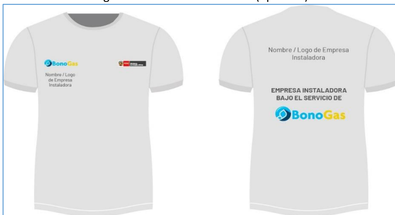
Fig. 03: Polo de Identificación (opcional)