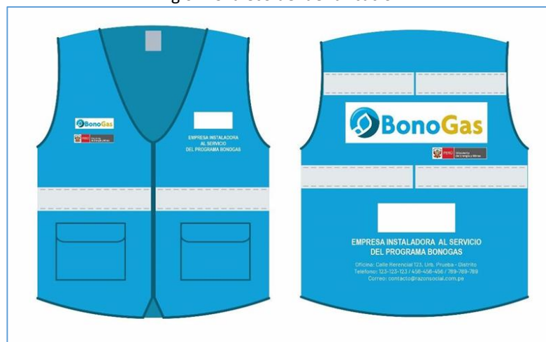
Fig 02: Chaleco de Identificación